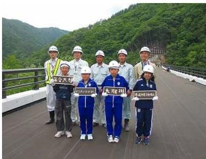
《落合大橋で記念撮影》