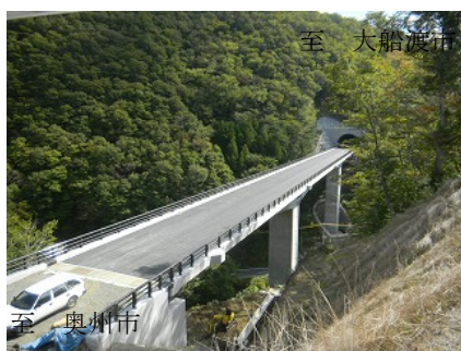
《完成した一ノ渡大橋》