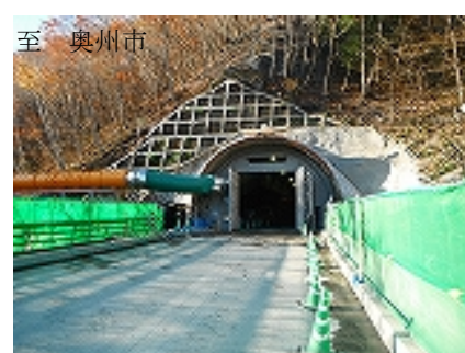
《子飼沢トンネルの現在の状況》

津付ダム建設事務所では、付替国道工事について学校、自治会等団体の現場見学会を開催します。 現場の見学を希望する場合は、安全対策に万全を期す必要があるため、事前に津付ダム建設事務所にお問い合わせ願います。 【問い合わせ】 津付ダム建設事務所 TEL : 0192-22-8182 津付ダム建設事務所のHP http://www.pref.iwate.jp/~hp4580/ 津付ダム付替国道（津付道路）HP http://www.pref.iwate.jp/~hp4580/tuduki-road/