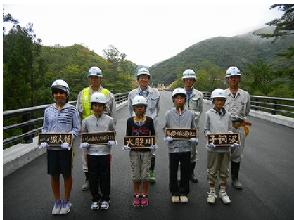
《一ノ渡大橋で記念撮影》