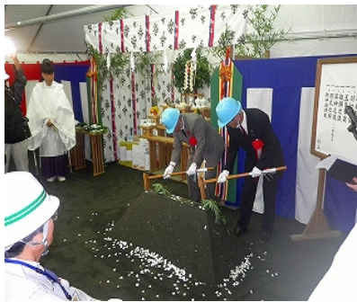
《住田町長、町議会議長による鉋入れ》

子飼沢トンネルは、延長901メートルで付替国道の中で一番長いトンネルであり、平成26年以内に完成の予定です。