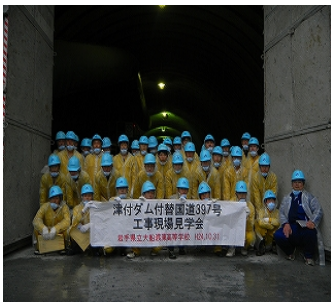
《トンネル現場前で記念撮影》