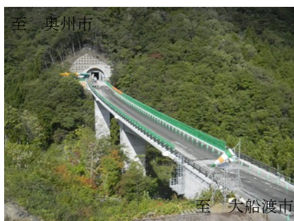
《完成した落合大橋》