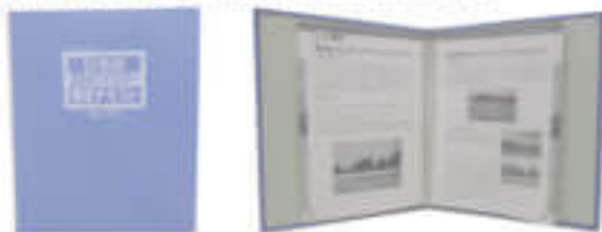
「ひろのふるさとマイスター検定テキスト」