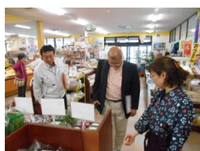
昨年度の指導状況