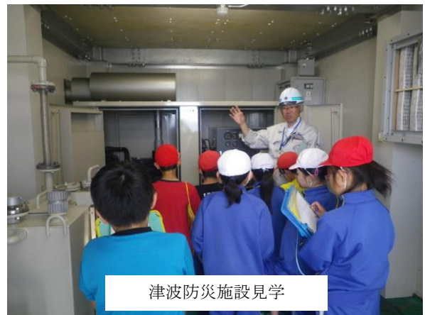
津波防災施設見学