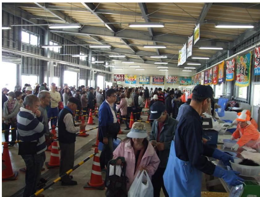
写真 会場の様子（H29. 5. 28）