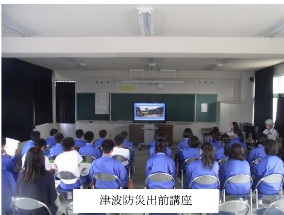
津波防災出前講座