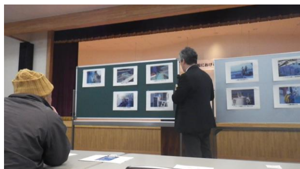
作業方法の見直しに係る意見交換