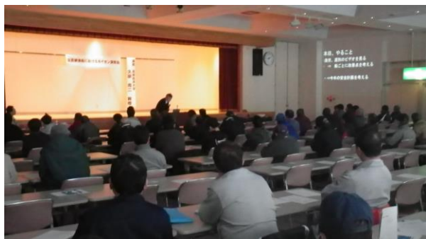
昨年度の講習会の様子

当講習会は平成 29 年度地域経営推進費「定置網漁業へのカイゼン手法導入事業」により実施するものです。