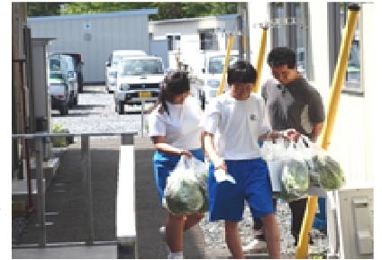
～自分たちが育てたレタスを直接届けました～