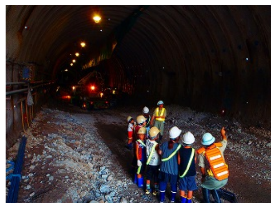
全長 1,150mに及び案内トンネル 工事現場見学会の様子

県北広域振興局土木部道路整備課 電話 0194-53-4990 メールアドレス BK0006@pref.iwate.jp