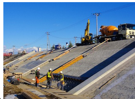
「久慈川堤防嵩上げ工事」

海岸防潮堤は、野田村野田地区、洋野町八木地区でも着手し、水門・陸閘の整備も併せて進めています。