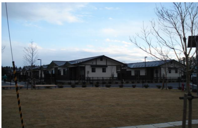
外観 災害公営住宅 (門前小路第2地区)

担当：土木部建築指導課 武藤 一夫 電話：0194-53-4990 内線 268