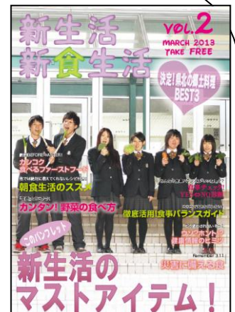
表紙は高校生が考案した「ファッション雑誌風」となっています。

「災害時レシピ」のページでは、被災地の高校生自身が停電によって炊飯器が使えなかった経験から、「鍋で炊くごはん」等のレシピを提案しています。