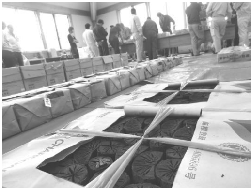
昨年度の審査会の様子

炭の種類ごとに、断面の美しさや炭化の度合いなど7項目で審査が行われ、最優秀賞（農林水産大臣賞）、優秀賞（林野庁長官賞）を選出します。