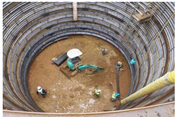
図 2 : ライナープレート工法現場写真 (10 月 4 日)