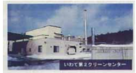
いわて第2クリーンセンター処理フロー