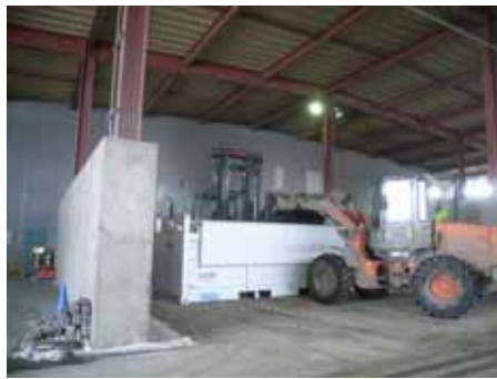
県境不法投棄現場からいわて第2クリーンセンターに搬出された廃棄物（RDF様物）

RDF（ごみ固形化燃料）とは、紙くずやプラスチックなどを燃料として利用できるように成形したものです。不法投棄現場には、外観をRDFに偽装しながら、金属やガラスなど不燃物が混ざられ、実際には燃料として使えない「RDF様物」が投棄されています。