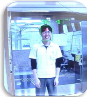
パソコンの画面上に体温が瞬時に表示されます。

編集後記 穏やかな山田湾に沿って、境田町から織笠方面へと薫風を全身で感じながら散歩していると、マリンスプーとスカイブル、そして青葉がともなう刺激と入ってきます。青色の効果は、集中力を高める、食欲をコントロールできる、興奮を抑え気持ちを落ち着かせる、時間経過を遅く感じる、睡眠を促進するなどの効果があるそうです。新型コロナウイルス感染症のことで、なかなか以前のようにいきませんが、新しい生活様式を工夫しながら、心身とも健康でありたいと思