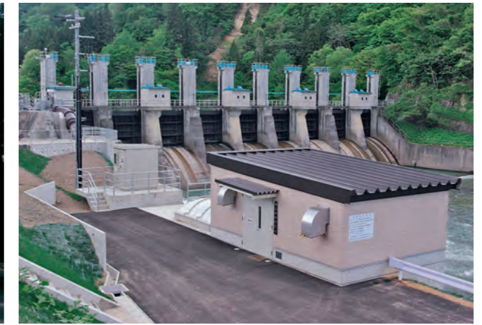
胆沢第四発電所と若柳堰堤