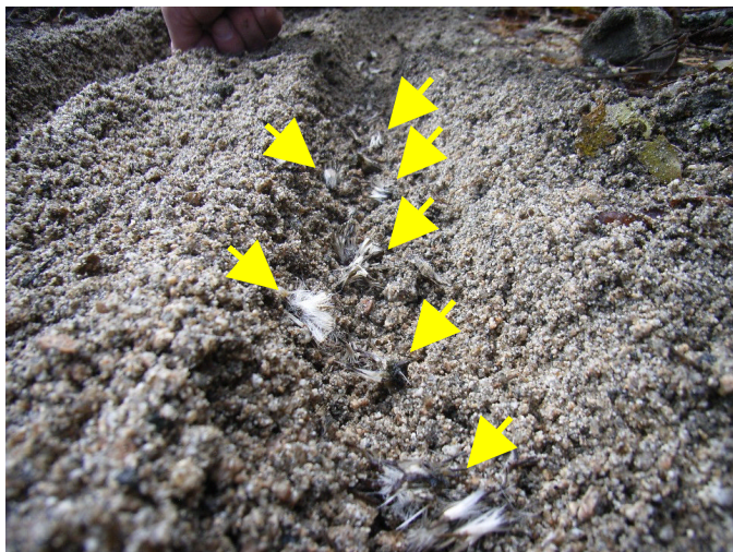
溝に種を蒔き、砂を被せた