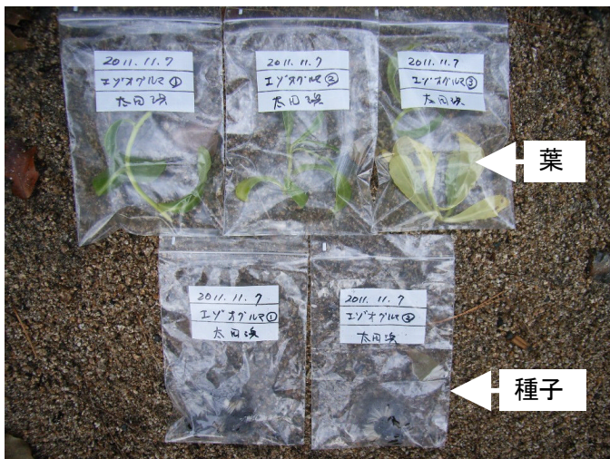
種子、葉をサンプリング