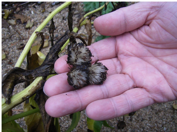
枯れかけているが、種子が付いている