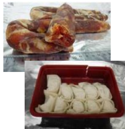
アフリカ豚コレラウイルス遺伝子が検出されたソーセージ及び餃子