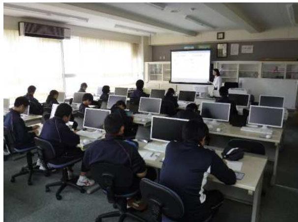
↑土砂災害について学習中！