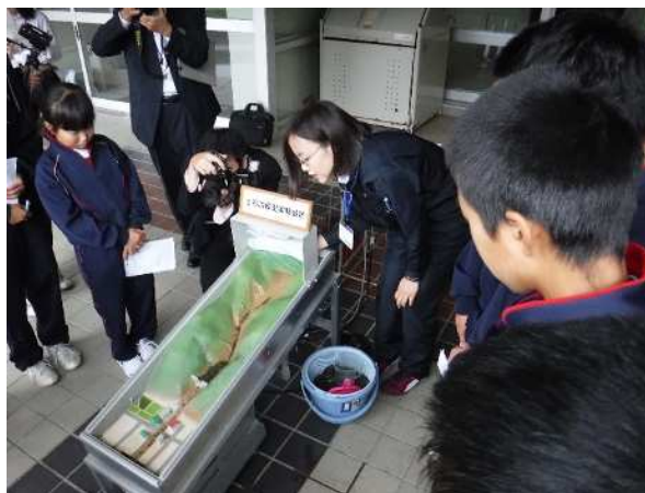
←模型実験で土石流と砂防堰堤の効果を確認