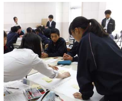
↑ワークショップでチームの考えをとりまとめ中