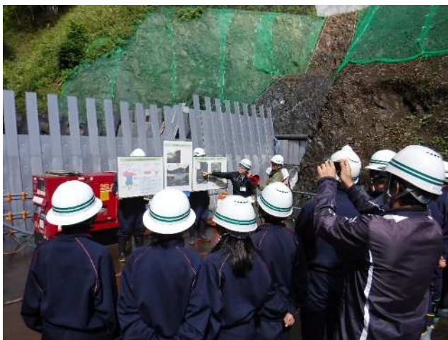
↑ 施工中の砂防堰堤を見学！！ →