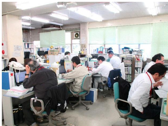
宅地造成は完了、自力再建の加速へ