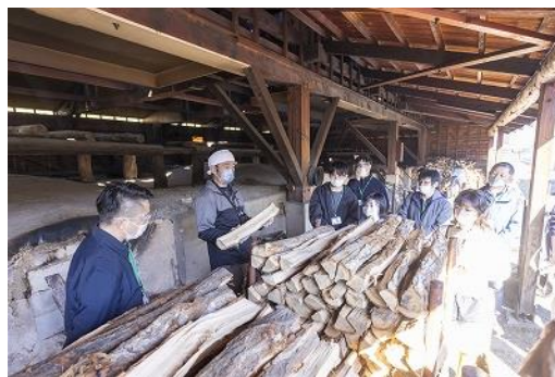
【(有)谷地林業 木炭製造工程の見学】