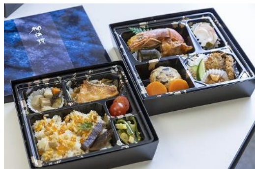
【はまなす亭本店 昼食】