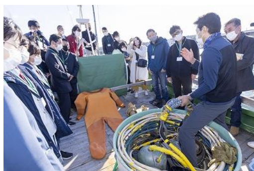
【種市漁港 南部潜りの漁具見学】