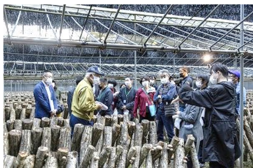
【原木しいたけ ほだ場見学】