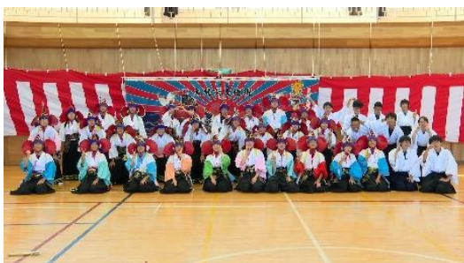
久慈市立夏井中学校 「夏井大梵天神楽」