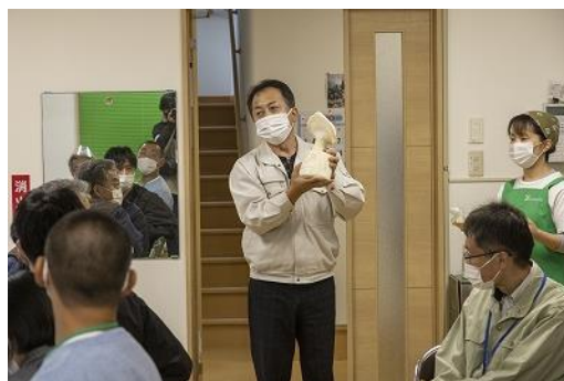
【長根商店 あわび茸講話】