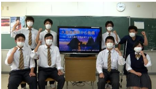
岩手県立久慈東高等学校 総合学科海洋科学系列