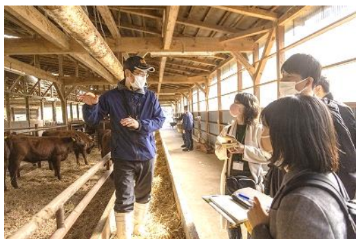
【いわて短角牛 牛舎見学】