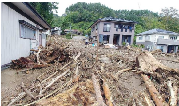
【普代の沢・普代村普代地区】