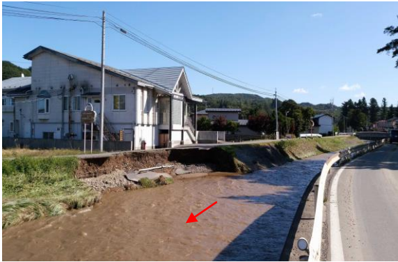
【小屋畑川・久慈市長内町】