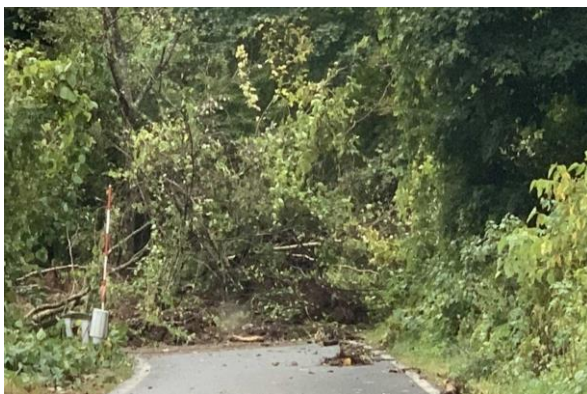
【普代小屋瀬線・普代村上普代地区】