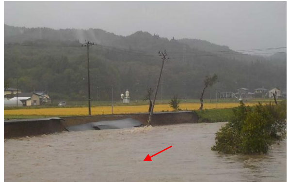
【夏井川・久慈市夏井町】