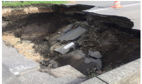
【角ノ浜玉川線・洋野町川尻地区】