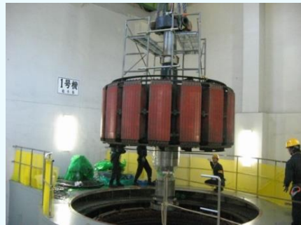
仙人発電所のオーバーホールの様子