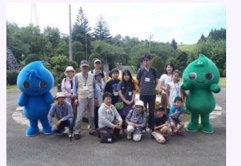
施設見学会の開催