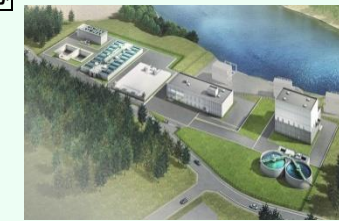
新浄水場 完成予想図