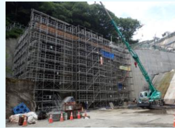
建設中の築川発電所