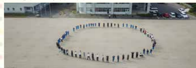
校庭で笑顔を見せる吉里吉里学園中学部の生徒たち。

これにより、閉校・廃校した7校の344戸を除く、県内28校の校庭に建設した2,068戸の応急仮設住宅全ての撤去が完了し、児童生徒たちが校庭を使える環境に戻りました。