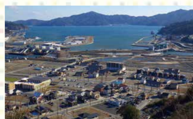
津波から市街地を守る、大槌川水門(左奥)と小槌川水門(右奥)。

大槌町は、大槌湾へ流れ込む2つの川に挟まれるように市街地が形成されていますが、震災時はこの川からも津波が流れ込み、被害が拡大しました。そこで大槌川河口に新たな水門を、小槌川河口には水門を再築し、それに伴う河川施設の復旧工事を進めており、この3月から津波防護機能が発現します。2つの川の間をつなぎ、市街地を守る壁となる津波防潮堤も、同時に機能します。