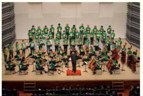
佐渡裕氏とスーパーキッズ・オーケストラによるコンサートなどを実施した「さんりく音楽祭2019」。