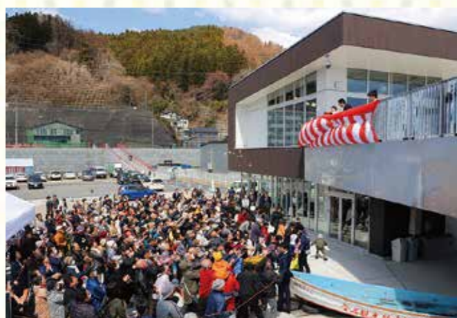
オープン日に多くの市民でにぎわう「魚河岸テラス」。

「海、魚のまち釜石」を発信するため、釜石市が新たなにぎわいの拠点として整備を進めてきた「魚河岸テラス」が、昨年4月にオープンしました。1階には物販コーナーや郷土芸能の紹介スペース、2階には地元食材を提供する飲食店や展望テラスなどが設けられています。昨年9月には、国土交通省により「みなとオアシス」に登録され、地元住民も観光客も利用できる拠点としての活用が期待されます。