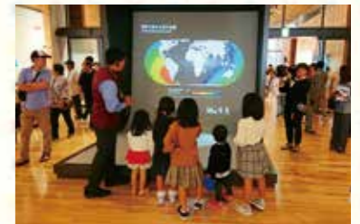
子どもたちに地震のメカニズムを説明する解説員