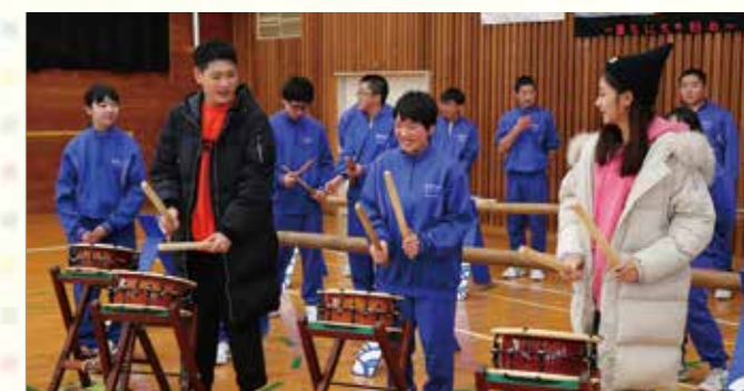
台湾のゲストと創作太鼓で交流する野田中学校の生徒たち。

東日本大震災津波からの復旧・復興を支援していただいた海外の国や地域と交流し、絆を深める「復興『ありがとう』ホストタウン」。県内では、沿岸部を中心に12市町村が取り組んでいます。野田村では、昨年、台湾の著名人を招いて中学生と創作太鼓の体験をするなど、地域の魅力を伝えながら交流を広げています。東京2020オリンピック・パラリンピック競技大会をきっかけに、復興支援で結ばれた絆をさらに深め、大会後も継続的に交流を続けていく予定です。