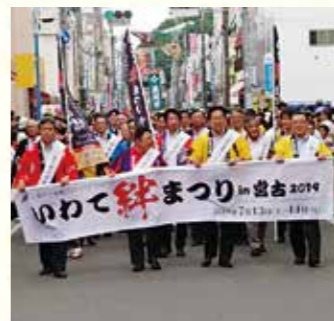
県内の郷土芸能が集結した「いわて絆まつりin宮古2019」。

昨年の6月1日から8月7日の68日間 にわたって、沿岸13市町村を舞台に「三陸防災復興プロジェクト2019」が開催されました。期間中は、防災復興シンポジウムのほか、三陸ならではの食やお祭り、三陸ジオパーク、三陸鉄道など、22の多彩な事業を通して復興の今と三陸の魅力を発信しました。これからも震災の教訓や復興状況を発信し、国内外の各地域との交流をさらに深めていきます。