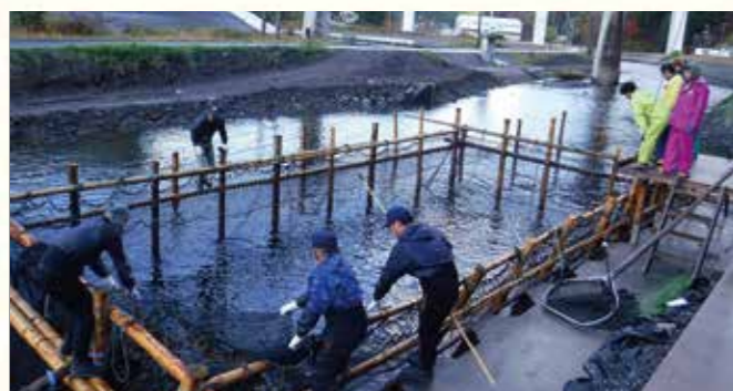
釜石市で採卵のためのサケの親魚を捕獲する作業を学ぶ研修生たち。

水産業の担い手を育成するため、昨年4月から、地域の漁業をリードする人材を養成する「いわて水産アカデミー」を開講。第1期となる令和元年度は7人が受講し、1年をかけて漁業の技術を習得するとともに、関係法令や6次産業化、情報通信技術を活用した漁業などを学びました。