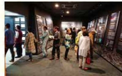
震災時の行動を伝えるパネルを見学する来館者