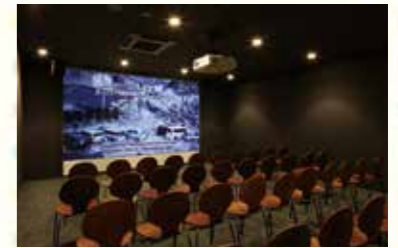
映像で震災の事実と教訓を伝えるVR体験シアター