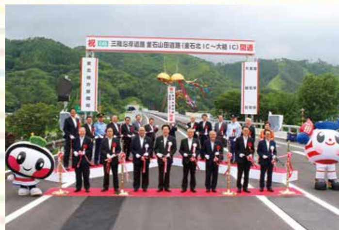
昨年6月に行われた釜石北IC～大槌IC開通式の様子。

昨年6月、三陸沿岸道路の釜石北 IC～大槌 IC (4.8km)が開通し、宮古市から宮城県気仙沼市まで(約106km)が自動車専用道路で結ばれました。また、3月1日には、久慈北IC～侍浜IC(7.4km)が開通。