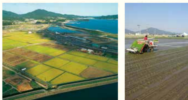
昨年5月に田植えが始まった陸前高田市高田沖地区。

被災した沿岸部の農地は、昨年春に、復旧対象となる542ヘクタールの全てで整備が終わり、作付けが可能になりました。震災をきっかけに、被災していない農地もほ場整備を実施し、併せて、農事組合法人を設立した地域もあり、各地域で意欲的に農業経営が展開されています。