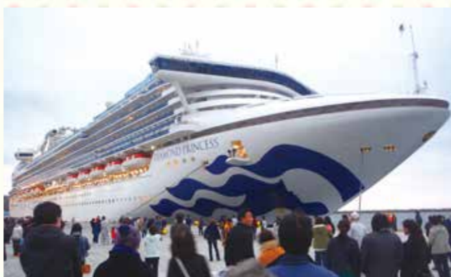
昨年4月に宮古港に寄港した「ダイヤモンド・プリンセス」。今年の4月22日と10月26日にも、宮古港に寄港予定です。

県は、観光や地域の振興につながるクルーズ船の寄港拡大を図るため、港湾所在市と連携して、国が主催するクルーズ船社幹部による県内視察の実施や世界最大のクルーズ船見本市への出展などを通じて、県内の港湾をPRしています。これにより、昨年4月、宮古港に、大型クルーズ船「ダイヤモンド・プリンセス」が寄港しました。アメリカのクルーズ会社が運航するこの船は、全長290メートル、総トン数11万5,875トンで、10万トンを超えるクルーズ船が寄港するのは県内初となりました。