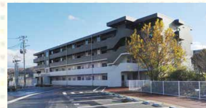
1月に完成した北上市の県営黒沢尻アパート。

県と市町村が沿岸部に整備していた災害公営住宅5,550戸は、昨年11月に全て完成。県と市が内陸6市(盛岡市・花巻市・北上市・遠野市・一関市・奥州市)に建設中の283戸も、盛岡市南青山地区の住宅を除き、昨年11月に全て完成しました。盛岡市南青山地区の99戸は、令和2年度に完成予定です。