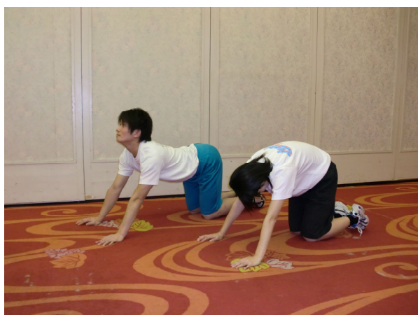
たけのこ(キャットストレッチ)