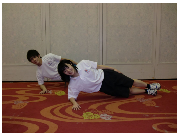
時間よとまれ②(姿勢保持で横向一直線)