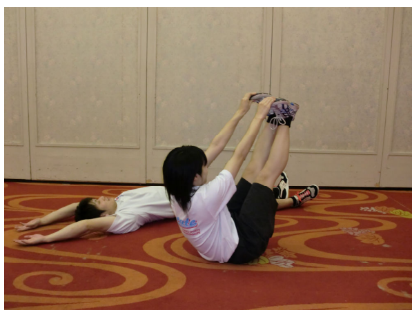
つま先キャッチ（V字腹筋）