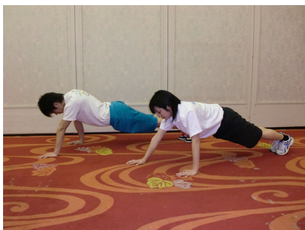
エッフェルトカゲ(前後差腕立て伏せ)