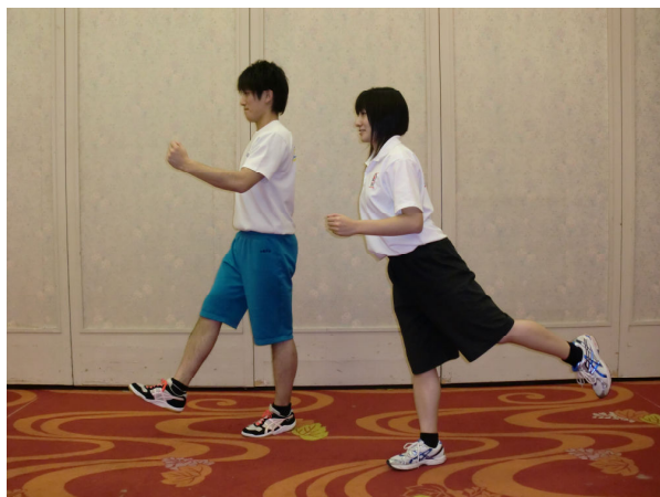
フットブランコ(レッグスイングキープ)