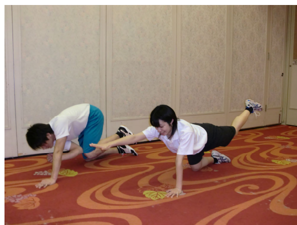
待って(手足対角上げキープ)