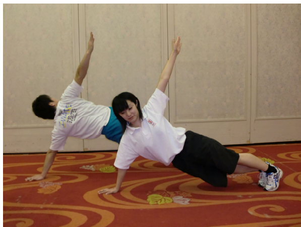
Tの字（腕立て伏せ→横向き交互）