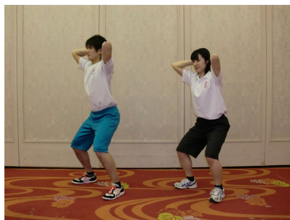
ジャンプアップ(スクワット)