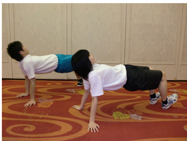
時間よとまれ③(姿勢保持つま先上げる)