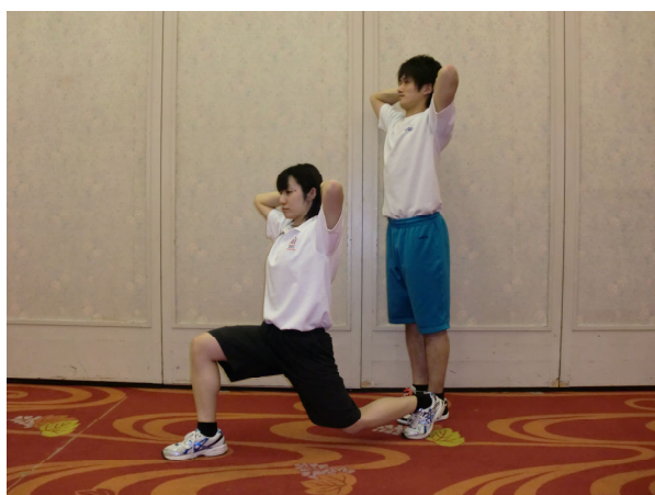
ダッシュアップ（レッグランジ左右交互）