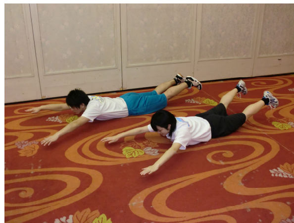
おぼれない（対角交互にスーパーマン）