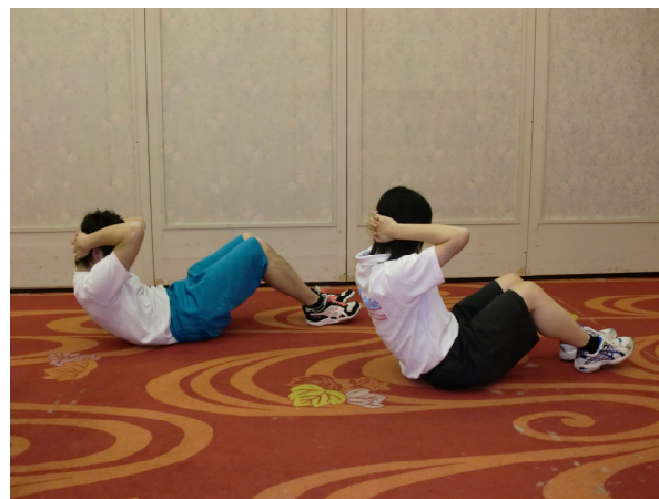
おなかギユ(シットアップ)