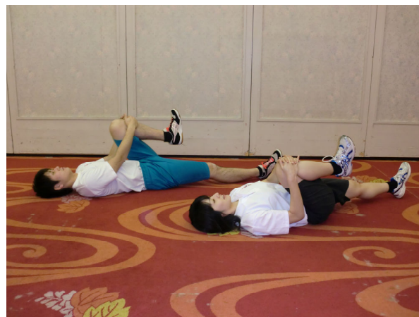
膝大好き(シングルレッグストレッチ)