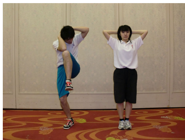
くびりたい（ツイストニーアップ）