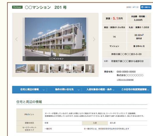
物件掲載ページ (イメージ)