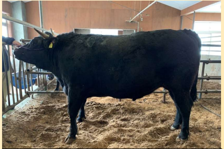
優良賞を受賞した「菊福秀」産子 「水農白清3」号