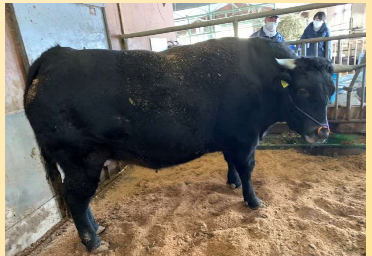
審査員特別賞を受賞した「美国桜」産子 「水農陸助」号