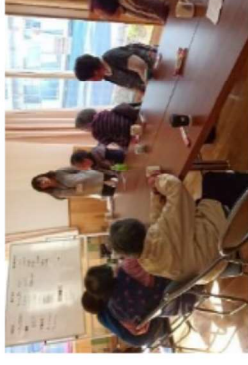
移転先での新たなコミュニティ形成に向けて