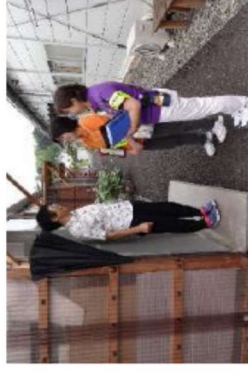
生活支援相談員による見守り活動