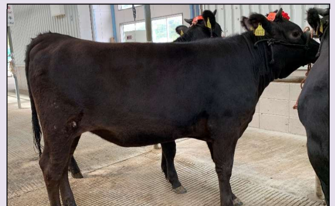
③ 県南市場1日目 雌産子 体伸に富み、輪郭鮮明な産子。体重/日齢が1.05と良好な増体を示しました。