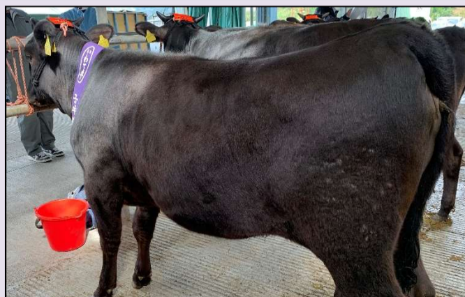
② 県南市場1日目 雌産子 2代祖「菊福秀」の産子。増体が良好だった上、kg単価も2,518円と平均を大きく上回りました。