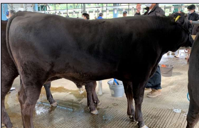
① 県南市場1日目 去勢産子 父同様、体伸に富み、中後軀が充実した産子。全市場平均を約15万円上回る高値で取引されました。