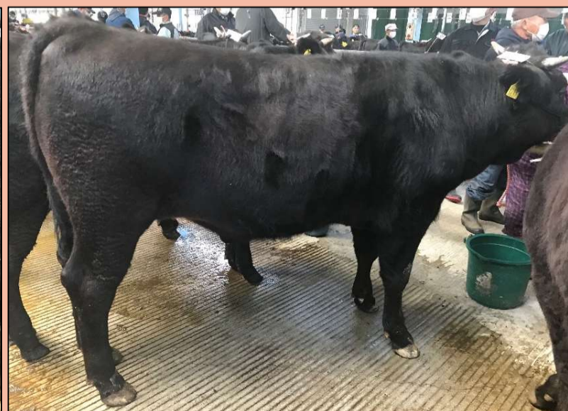
② 県南市場1日目 (去勢)

高さ、幅、伸びが良く、体上線のきれいな産子。 体重/日齢1.34と増体良好で迫力がありました。