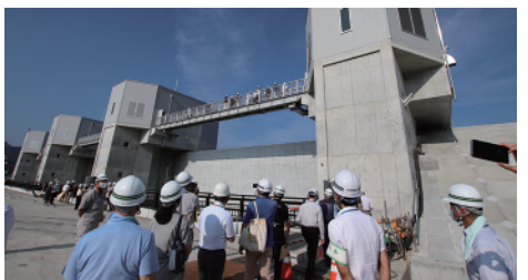
水門現場の視察の様子

東日本大震災津波から 10 年目の復興の姿について理解を深める機会となりました。