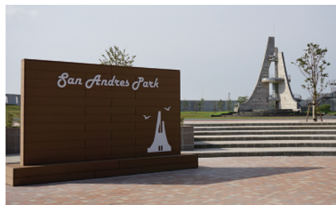
サン・アンドレス公園

1611年にスペイン使節セバスチャン・ビスカイノが大船渡に入港した日が聖アンドレスの祭日だったことにちなんで「サン・アンドレス公園」と命名されたこの公園は、地域の声を活かし、海側に築山（つきやま）を作り、防潮堤より内側からでも海が見えるよう整備しました。今後、市民の憩いの場として利用されます。