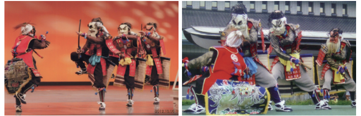
「赤澤鎧剣舞」の演舞の様子

皆様からの支援に感謝し、今後も地域の子どもや先輩の人たちと赤澤鎧剣舞の継承に努めていきます。