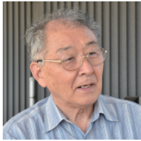
赤澤芸能保存会 会長 大船渡市郷土芸能協会 会長