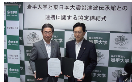
小川岩手大学長（左）と達増知事（右）