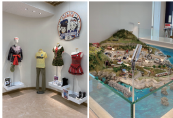
ドラマ「あまちゃん」の展示物

「YOMUNOSU (よむのす)」は、1階に駅前観光交流センターや喫茶スペース、多目的室などが整備され、2階、3階は、市立図書館として約10万冊の書物が収蔵されています。市民の公募により名付けられた施設の愛称は、地域の方言で「読むのす＝読むのです」と、子どもたちが図書館で学び巣立ってほしいという願いから「読むの巣」と