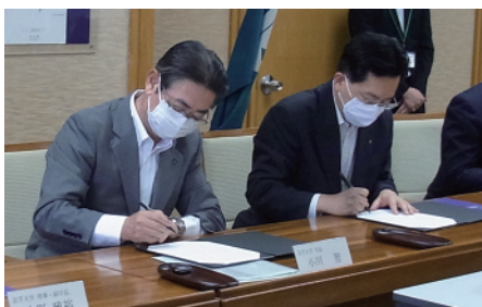
協定締結式の様子