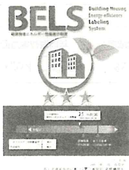
〔図1〕ガイドラインに基づく第三者認証の例

また、デマンドリスポンスに対応した時間帯別・季節別の電気料金メニューが選択できる場合はその活用にも努めるとともに、エネルギー管理システム（BEMS・HEMS等）の導入により、ビルの運用方法、住宅の住まい方の改善によるピーク対策及び省エネルギーに努めること。