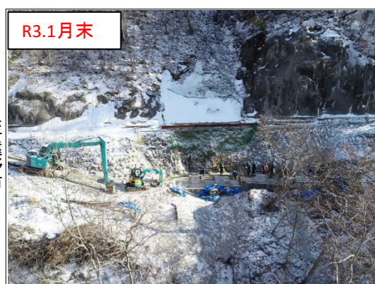
施工状況 谷側上空より(撮影:R3.1月末)