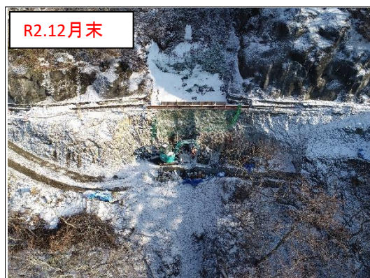
施工状況 谷側上空より(撮影:R2.12月末)