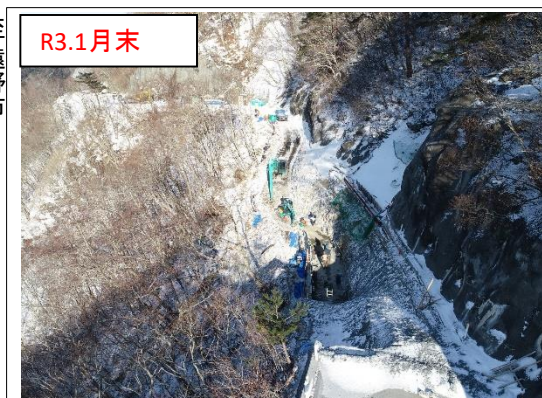
施工状況 金石側上空より(撮影:R3.1月末)