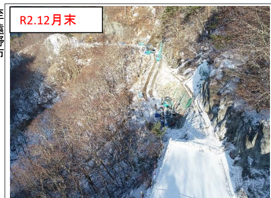
施工状況 金石側上空より(撮影:R2.12月末)