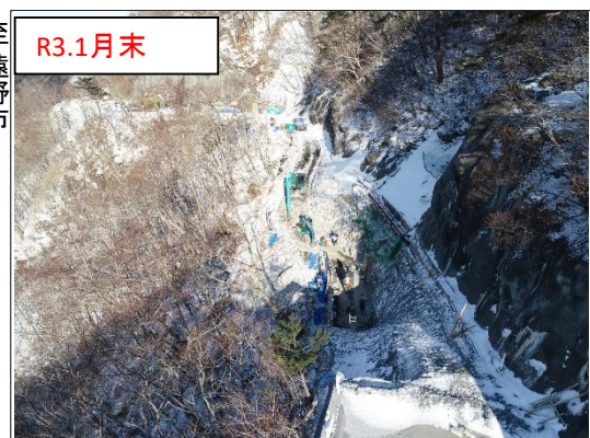
施工状況 金石側上空より(撮影:R3.1月末)