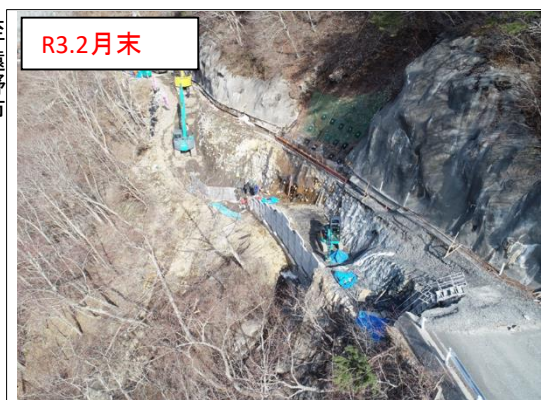
施工状況 金石側上空より(撮影:R3.2月末)