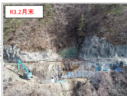
施工状況 谷側上空より(撮影:R3.2月末)