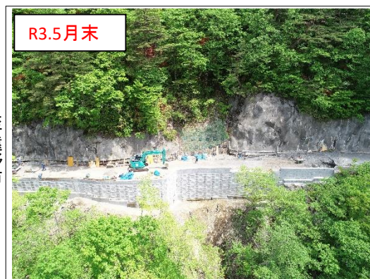
施工状況 谷側上空より(撮影:R3.5.31)