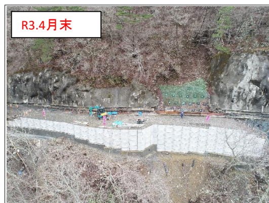
施工状況 谷側上空より(撮影:R3.4.30)