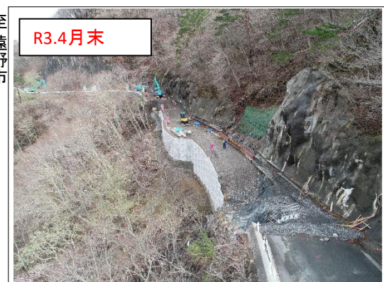
施工状況 金石側上空より(撮影:R3.4.30)