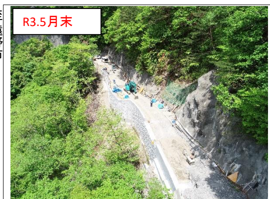
施工状況 金石側上空より(撮影:R3.5.31)