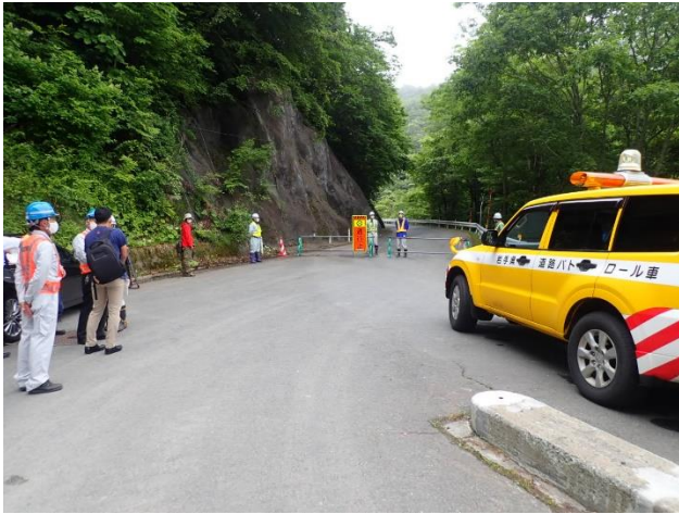
解除直前の様子(遠野側)