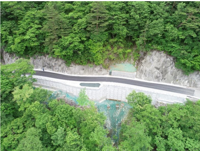
完成写真(谷側上空より)