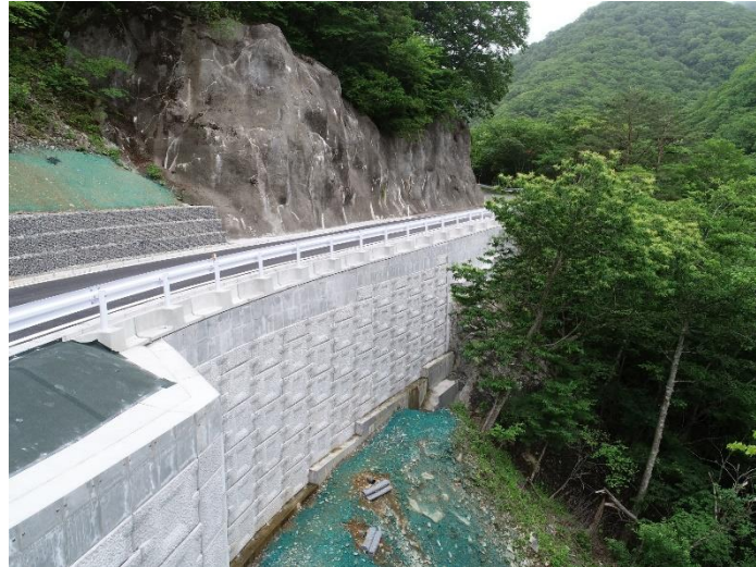
完成写真(遠野側より)