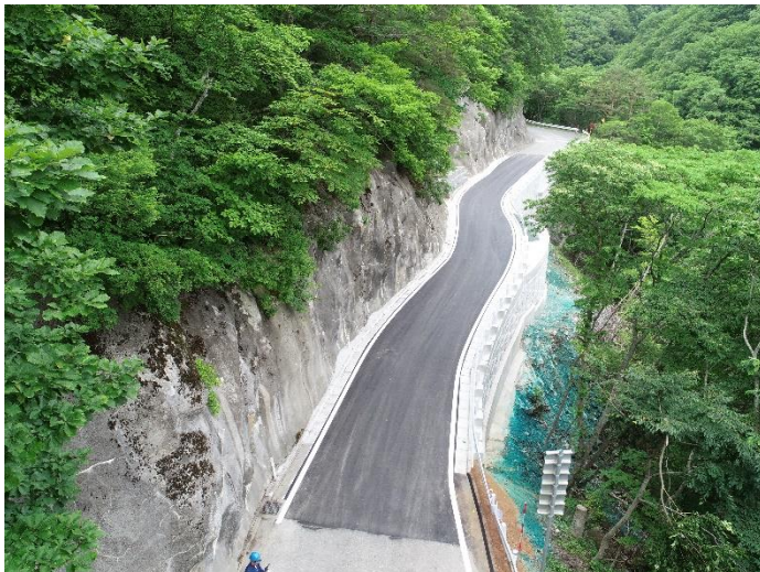
完成写真(遠野側上空より)