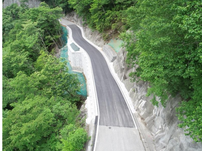
完成写真(釜石側上空より)