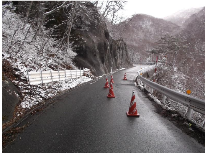
着手前写真(遠野側より)