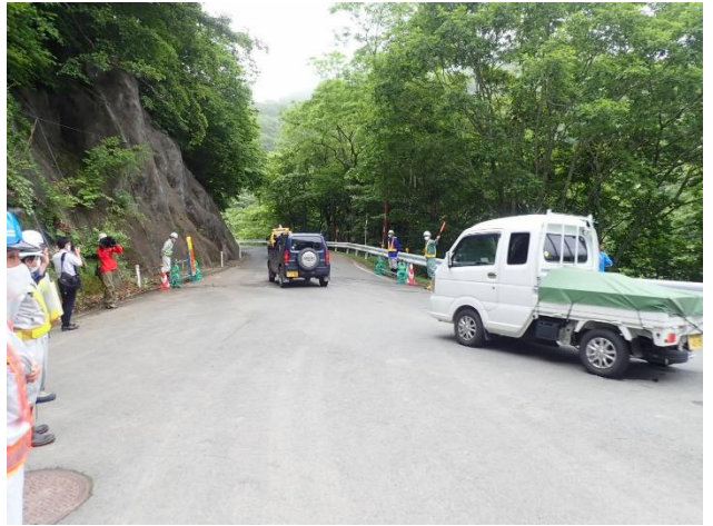
解除時の様子(遠野側)