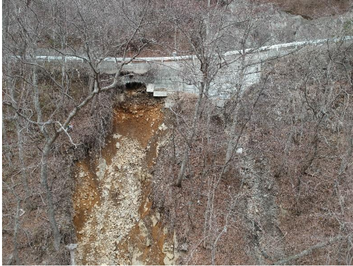
着手前写真(谷側より)