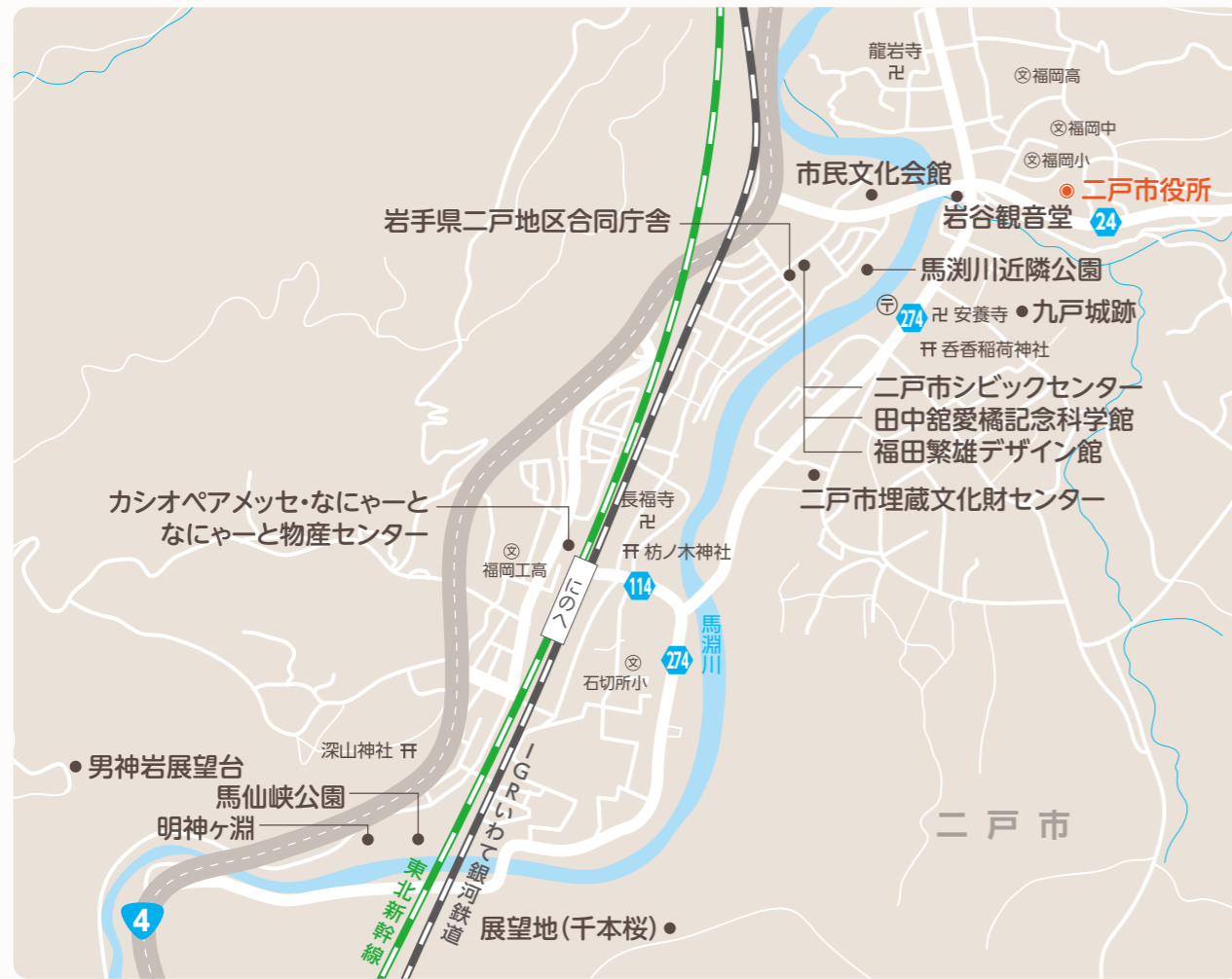
[ お問い合わせ先 ]