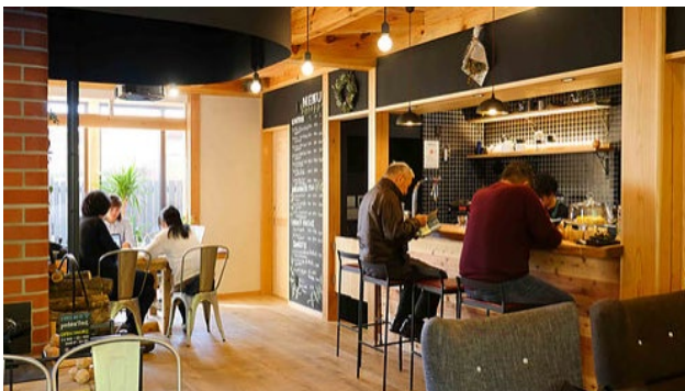
① コーヒー・軽食の提供