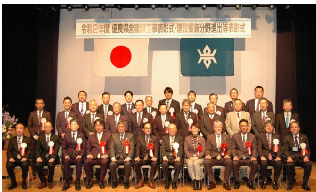
記念撮影(優良工事)