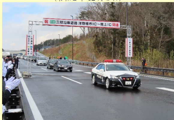
▲三陸沿岸道路「洋野町種市 IC～階上 IC」開通 (令和2年12月12日)