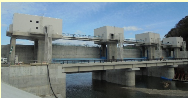
▲田代川(宮古市):令和3年3月整備完了