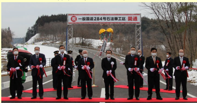
▲復興支援道路「一般国道284号石法華工区」開通 (令和3年1月24日)