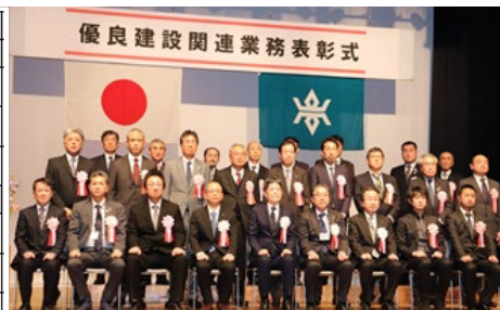
▲記念撮影(優良建設関連業務・技術者)