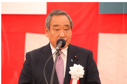
挨拶 大西 国土交通副大臣