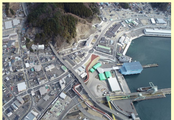
▲ 津波復興拠点整備事業「釜石市東部地区」 （令和2年3月撮影）