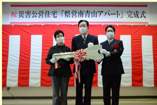
▲県営南青山アパート完成式:令和3年2月11日