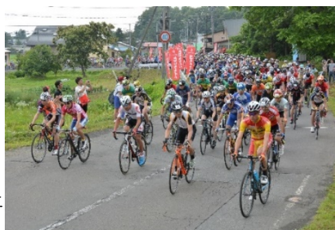
自転車関連大会の実施状況 (きたかみ夏油高原ヒルクライム)

【指標】自転車を利用する運動を実施した県民の割合 8.2%(R1(2019))⇒12.0%(R7(2025))