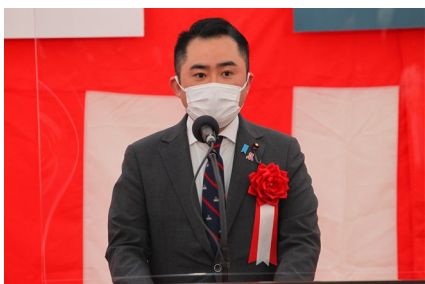
祝辞 吉川 復興大臣政務官