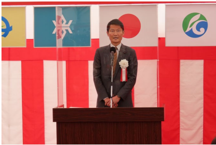
挨拶 朝日 国土交通大臣政務官

式典には、朝日 国土交通大臣政務官、達増 知事、遠藤 久慈市長、水上 洋野町長、県選出国會議員、県議会議員などの関係者が出席し、主催者代表挨拶や祝辞、お礼の言葉、テープカット、くす玉開披、通り初めのセレモニーが行われ、開通を祝いました。