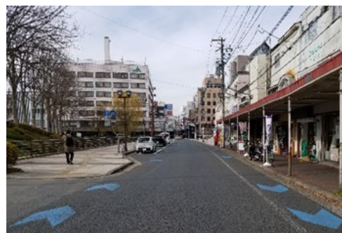
自転車通行空間の整備状況(盛岡市)

【指標】市町村自転車計画策定数 0市町村(R1(2019))⇒6市町村(R7(2025))