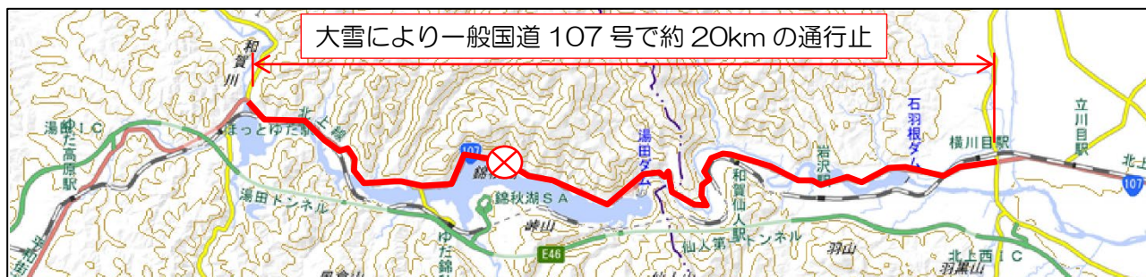
▲R2.12.16の一般国道107号の通行止位置図

今年度の大雪では、雪にタイヤがはまって立ち往生してしまう「スタック」状態となる車両も発生しました。北上市から西和賀町の一般国道107号では、令和2年12月16日に約20kmにわたり約8時間の通行止が発生するなどの交通障害も発生しました。