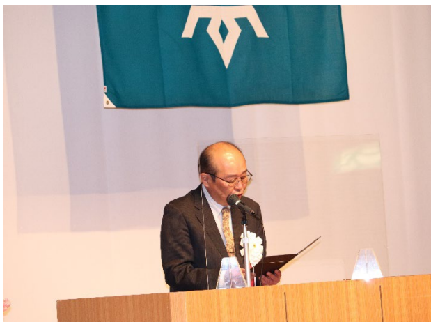
▲知事式辞(菊池副知事代読)