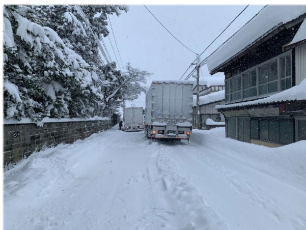
▲立ち往生した車両(写真左奥)を追い越せないトラック