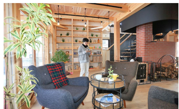
② 図書館（まちライブラリー）の運営