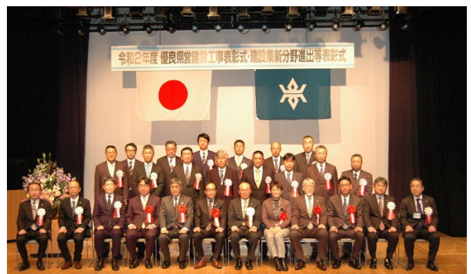
▲記念撮影(優良下請負企業)