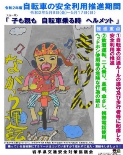
自転車の安全利用推進期間の実施による 自転車利用者の安全意識の高揚

【指標】 道路管理者が自転車通学ルートの安全点検を 実施した高校の割合 0.0%(R1(2019))⇒100%(R7(2025))