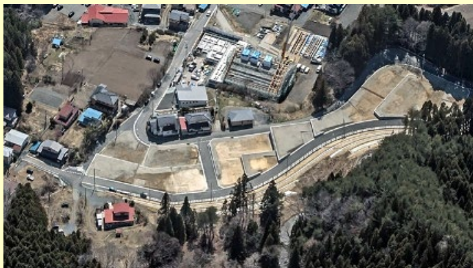
▲ 防災集団移転促進事業「大槌町赤浜地区」 （平成31年4月撮影）