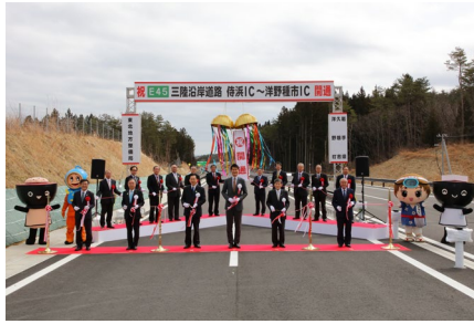
テープカット及びくす玉開披