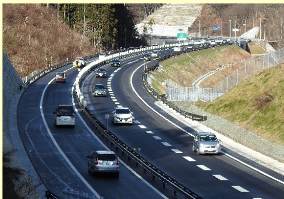
▲宮古盛岡横断道路「区界～築川」開通 (令和2年12月5日)