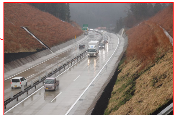
開通後の状況