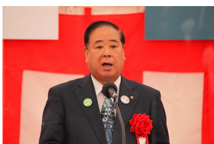
お礼の言葉 谷藤 盛岡市長