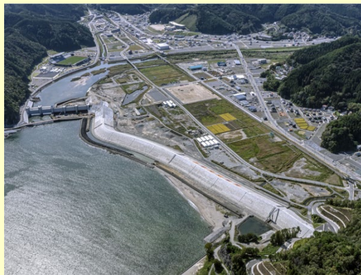
▲片岸海岸(釜石市):令和元年9月整備完了

また、津波発生時に現地で人が操作することなく、水門・陸閘を安全かつ迅速・確実に閉鎖できる「 水門・陸閘自動閉鎖システム 」の整備を進めており、今年度新たに気仙川水門（陸前高田市）など 72箇所 で運用を開始しました。 3月末までに214箇所のうち142箇所（約66%）が運用を予定 しています。