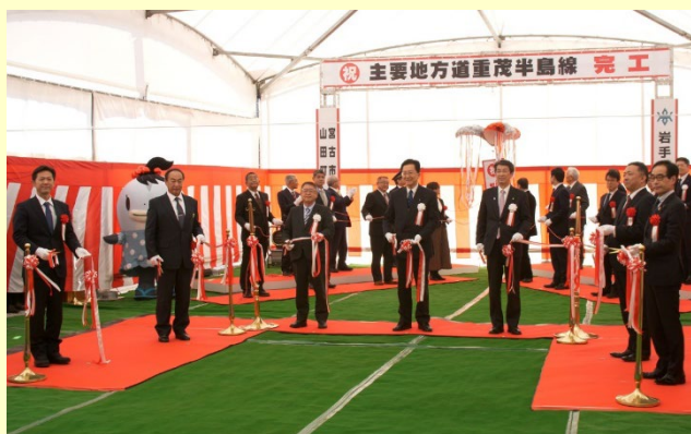
▲復興関連道路「主要地方道重茂半島線」完工式 (令和3年1月23日)