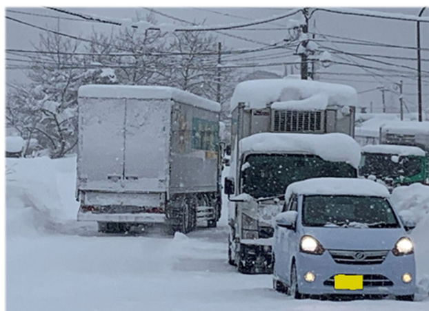
▲通行止による渋滞の様子