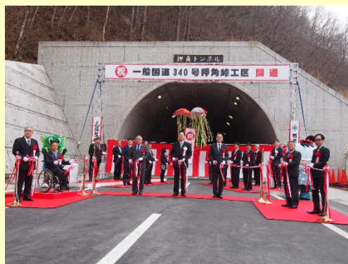
▲復興支援道路「一般国道340号押角峠工区」開通 (令和2年12月13日)