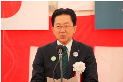
挨拶 達増 知事