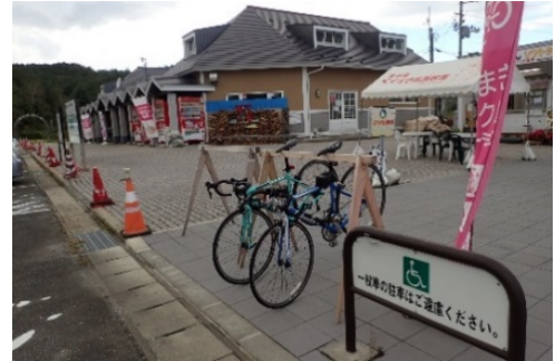
道の駅くずまき高原の サイクルラック設置状況

【指標】 路面表示や案内看板が整備された複数市町村に跨る 広域的なサイクリングルート数 0ルート(R1(2019))⇒4ルート(R7(2025))