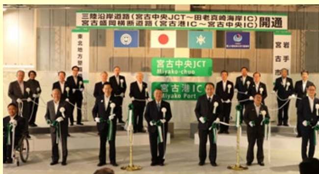
▲三陸沿岸道路「宮古中央 JCT～田老真崎 IC」 宮古盛岡横断道路「宮古港 IC～宮古中央 IC」開通 (令和2年7月12日)

令和2年度までに、 復興支援道路 については 整備計画箇所38箇所のうち35箇所 、 復興関連道路 については 整備計画箇所20箇所のうち19箇所 が開通しています。