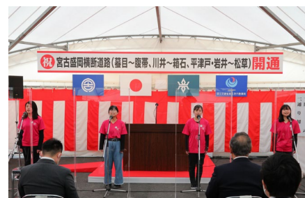
合唱 みやこ市民劇ファクトリー