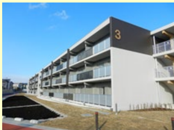
▲県営南青山アパート(盛岡市):令和2年12月完成