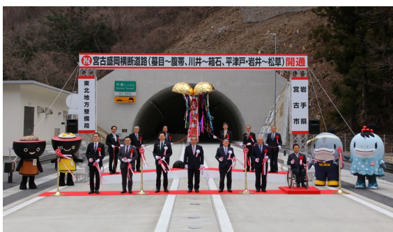
テープカット及びくす玉開披