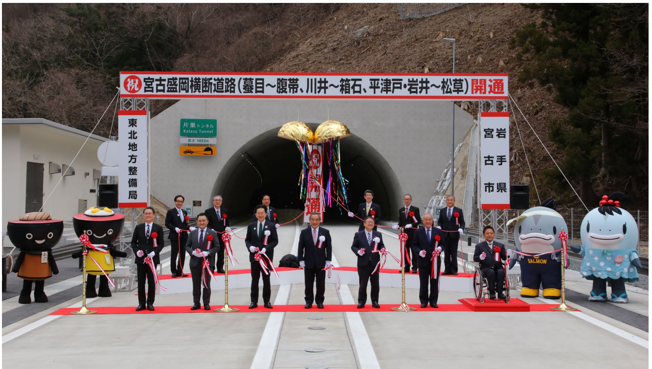
テープカット・くす玉開披

全線開通後は、宮古盛岡間の所要時間が震災前と比較して約30分も短縮されます。これにより、路線全体として安全性や速達性、定時性が大きく向上し、沿岸と内陸の更なる交流連携の促進、迅速かつ安定した救急搬送、広域観光や物流の活性化など多くの効果が期待されます。