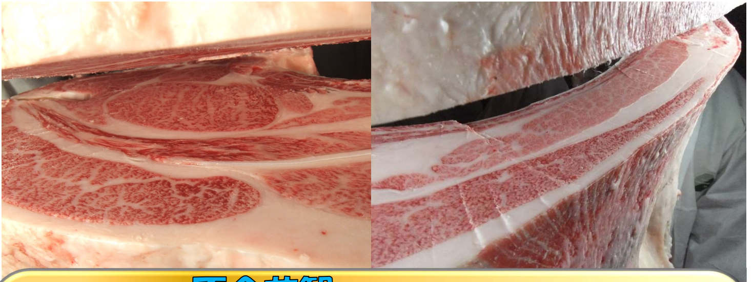
百合花智 × 菊福秀 × 福桜(宮崎) 枝重:523kg ロース:65cm 2 BMSNo.12