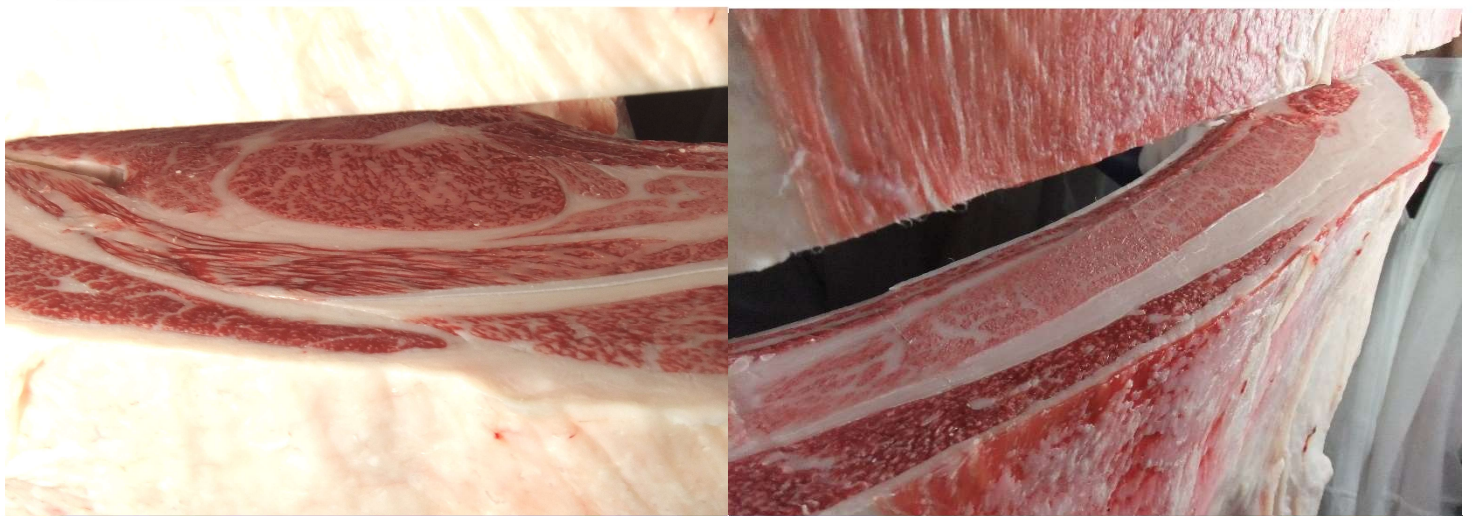
百合花智 × 忠富士 × 安平 枝重:453kg ロース:70cm 2 BMSNo.10