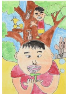
第70回全国植樹祭 (令和元年愛知県)

「第73回全国植樹祭ポスター原画募集」は、「令和4年用国土緑化運動・育樹運動ポスター原画岩手県コンクール」と併せて開催します。最優秀賞作品は第73回全国植樹祭ポスター原画として採用され、優秀賞、入選作品は、全国コンクールに推薦作品として提出されます。