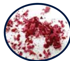
←鮮やかな色が残ったドライエディブルフラワー(画像はペゴニア)