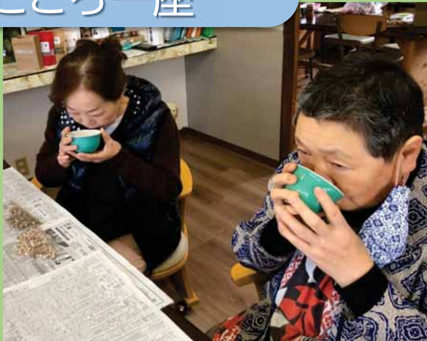
くろもじ茶を 試飲するメンバー