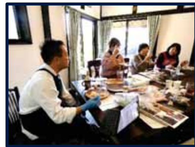
市内の若手シェフを講師に迎えての試食会。シェフ目線の辛口コメントをいただきました(笑)

農産物のドライ加工に興味を持ちつつも挑戦できずいたり、上手いかずに断念してしまった農業女子が市内にも少なからずいる現状を受け、互いに情報交換をしながら効率よくドライ加工に挑戦することができないかと団体化。加工方法に関することから、加工後の活用法(レシピや商品案)、販路に関する事まで、広く情報交換をしながら、試作に取り組んでいます。