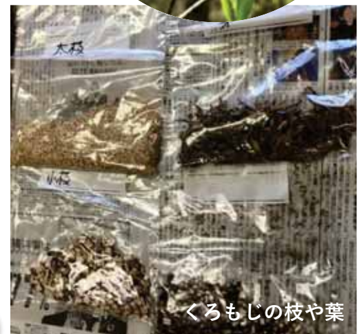
くろもじの枝や葉