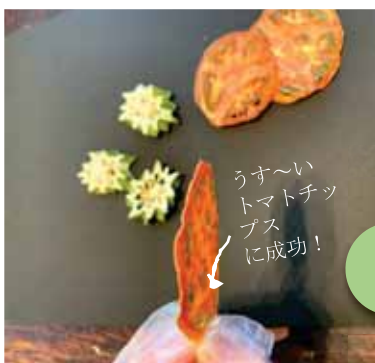
'ありそうでなかった'ドライ加工品を生み出すべく試行錯誤中!