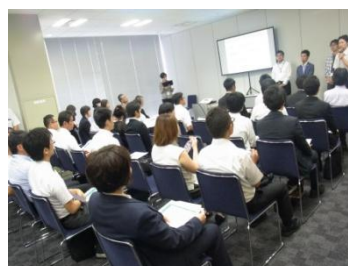
企業のプレゼンテーションの様子