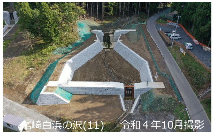
尾崎白浜の沢(11) 令和4年10月撮影