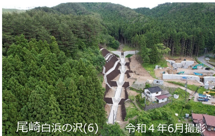
尾崎白浜の沢(6) 令和4年6月撮影

おかげさまで、砂防堰堤工事が完了しました。 工事へのご協力ありがとうございました。