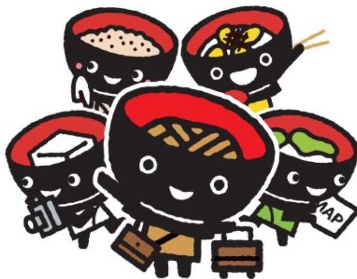
岩手県PRキャラクター「わんこきょうだい」