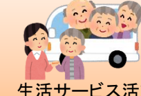
生活サービス活動 (声かけ・見守り 等)