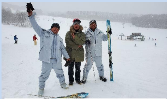
グリーン・ツーリズム体験