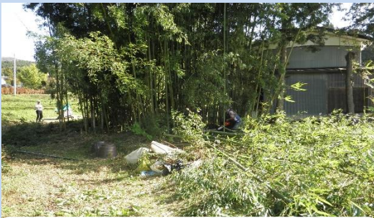
繁茂していた竹の伐採

これらの竹林整備を通じ、目に見えて集落の住環境が改善され、地域住民から喜びが生まれる活動となっています。そして、安心して生活できる集落を維持していくための重要な活動として、地域住民の理解と共感の獲得へつながっています。