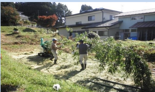
共同で取り組む竹林整備