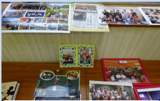
荷軽部集落の活動写真

さらに、平成22年には、青年会の有志により地域づくり団体「久慈まめぶ部屋」を結成し、郷土料理「まめぶ」を活用した県内外へのPRや、地域の子もたちへ伝承活動を精力的に行っています。また、集落ではグリーン・ツーリズムにも活発に取り組んでおり、国内外からの観光客に「まめぶ」作りや炭焼き体験などの地域資源を活用した体験メニューを提供しています。