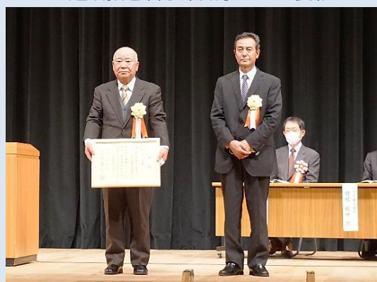
左から、竜ヶ坂中山間地域等直接支払交付金制度取組組織、荷軽部集落