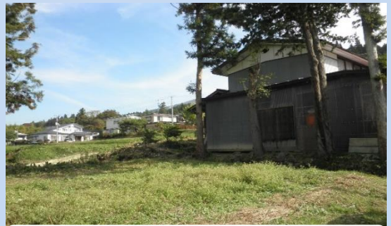
伐採により改善された景観