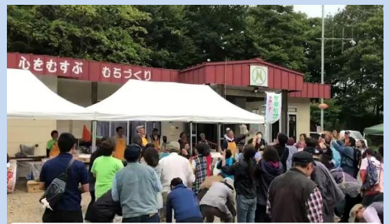
山形町での秋祭り（荷軽部会場）