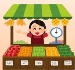
収益活動（農産物加工・販売 等）