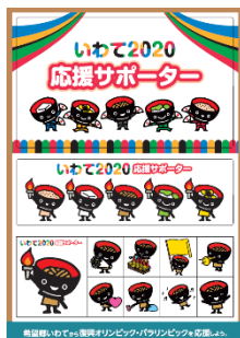
ステッカー完成イメージ