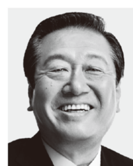
岩手3区 おざわいちろう 小沢一郎