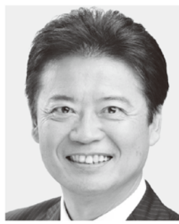
福島3区 げんばこういちろう げんば光一郎