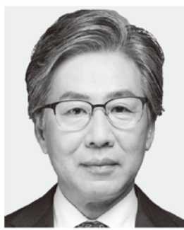
宮城5区 やすみ 安住淳