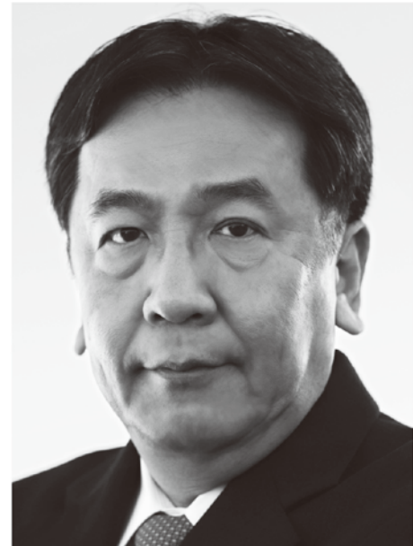
立憲民主党 代表 枝野幸男