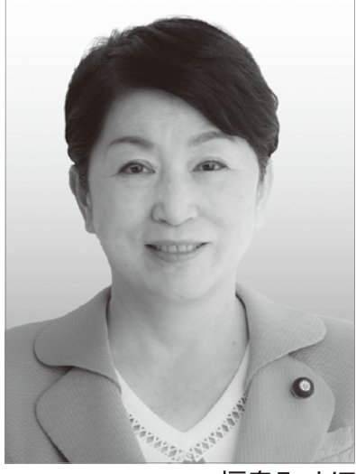
社民党党首 福島みずほ