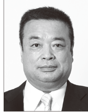
国民民主党 福島県総支部連合会代表