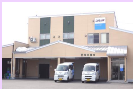
▲有限会社栄光商会 外観

一言メッセージ 「『喜びの種まき』を行い、社会に貢献する」を企業コンセプトとして、従業員一人ひとりが仕事を通して人間的な成長を目指し、自己研鑽に取り組んでいます。