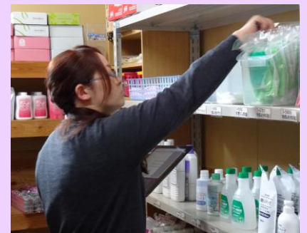
▲発注業務のベースとなる在庫チェック