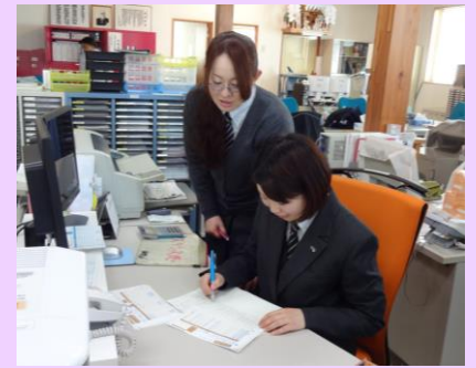
▲新人教育も大切な仕事