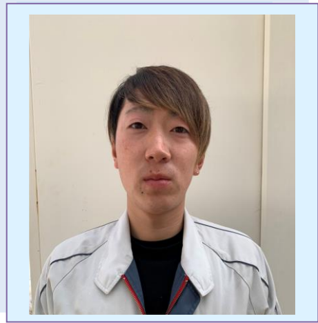
さかもと りゅう 坂本 龍