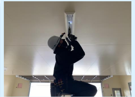
▲真剣です！ ▼社員旅行で台湾へ