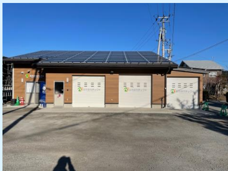
(株)カヌカテックプラス 事務所外観

一言メッセージ 当社は人材育成に大変力を入れており、資格取得は勿論のこと各種能力開発セミナーに積極的に参加します。当社若手社員は確実に成長し活躍しています。相協力して技術の伝承、且つ創造力を養いましょう。