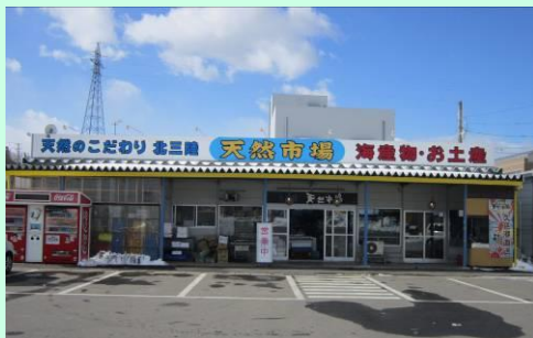
▲有限会社北三陸天然市場 外観

一言メッセージ 誰にでも新商品を開発出来る可能性があります。商品の見方を変えてみたい、新たな商品開発に挑戦してみたいという方、歓迎です！