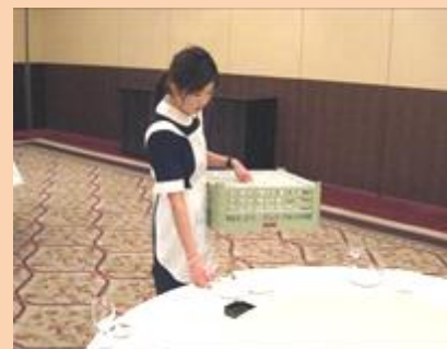
▲会場のセッティング

入社後、数カ月はレストランのサービスに従事し、現在は、婚礼（披露宴でのサービスの他、ナプキン等備品の準備）、法事（仕出しの際のサービス）、宴会などの接客サービスをしています。忙しい時には、レストランの接客もあります。サービスに付随する業務としては、会場の準備から片付けまであります。