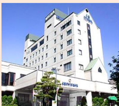
▲久慈グランドホテル 外観