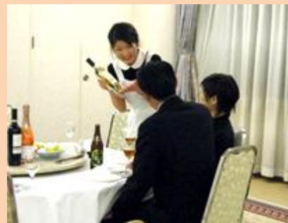
▲宴会の接客サービス

人と関わる仕事がしたいと思っていました。子供からご年配の方まで、たくさんの方々が来てくださるので、色々な出会いがあり、とても楽しいです。時間が不規則で不定休なので、大変な面もありますが、希望していた仕事で色々な人と関わる事ができ、勉強になる事も多く成長できると思います。