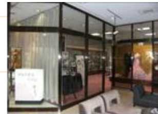
【ブライダルサロン】