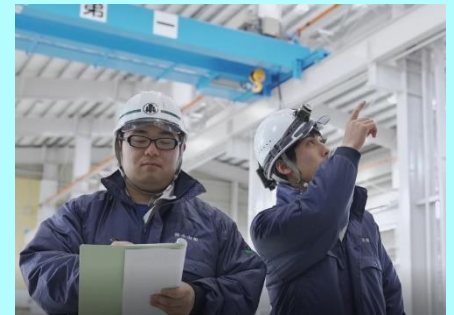
▲現場調査のようす