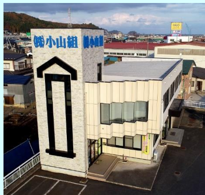
▲株式会社小山組 外観

1年単位の变形労働時間制 季節的な繁忙の差がある場合、繁忙期には週40時間を超える時間、閑散期には週40時間より短い時間の労働時間とし、1年を平均して週40時間以内の労働時間とすること