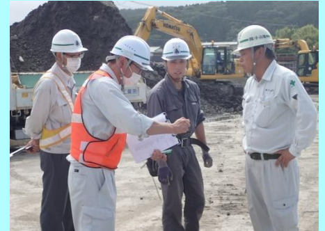
▲安全パトロールのようす

建設業に興味がある方はもちろん、仕事や先輩の話を知りたい方は、ぜひ当社に見学に来てください。