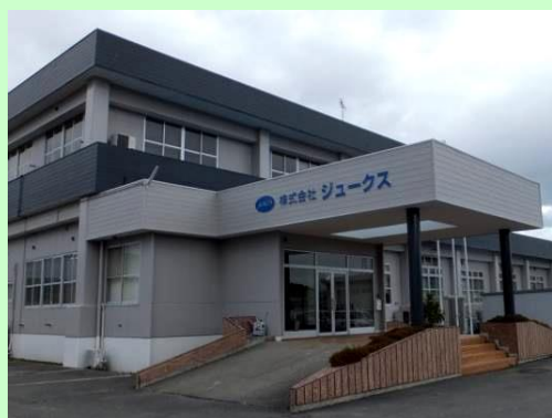
▲株式会社ジュークス 本社外観