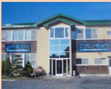
▲ 種市電工株式会社 本社外観