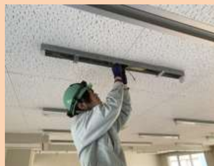
▲天井に蛍光灯を取り付ける作業

高校卒業後は飲食店で働いていましたが、高校時代に取得した第二種電気工事士の資格を活かした工事士の資格を活かした仕事をしたいと思い、電気工事の仕事へ転職しました。まだまだ分からないことばかりですが、周りの先輩方が丁寧に指導してくれるので、安心して作業ができています。今後は資格取得にも力を入れ、一日も早く会社の戦力になりたいと思っています。休日は好きなゲームで遊んだり、友達とご飯を食べに行ったりと、プライベートの時間も大切にしています。